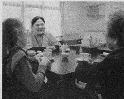
「エイジフリーハウス川崎有馬」の食堂でスタッフ(奥)と談笑する利用者ら。自宅と事業所の両方でサービスを受けられる

に認知機能が低下し、「要介護4」に。元の生活に戻るのは難しいと思われていたが、退院してユアハウスにしばらく宿泊した後、通いと訪問を組み合わせて自宅にいる時間を徐々に延ばし、退院1か月後には独り暮らしを再開したという。